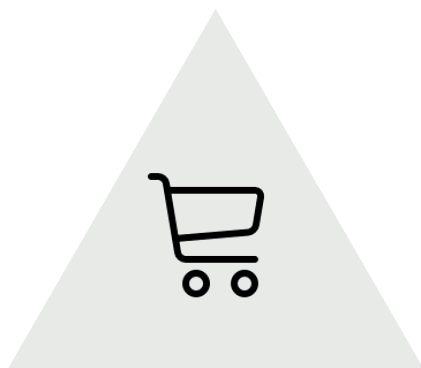
ECOMMERCE - WEB